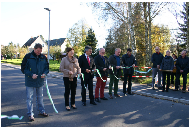
Fotos: Freigabe Radweg, Freigabe Neudorfstraße

Heute ist der Radweg bis zur Stadtgrenze in Löbau fertig und den Rest schaffen wir auch noch gemeinsam. Auch die ganze Neudorfstraße ist neu ausgebaut!